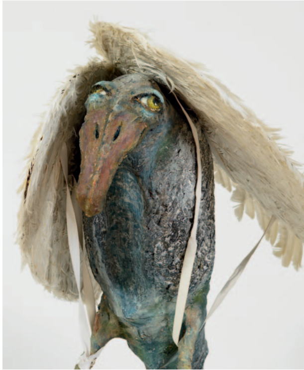
Ingrid Butschek, Papageier (Detail), 2016