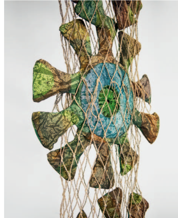
Angelika Brackrock, Aus der Gruppe „Beifang“ (Detail), 2024