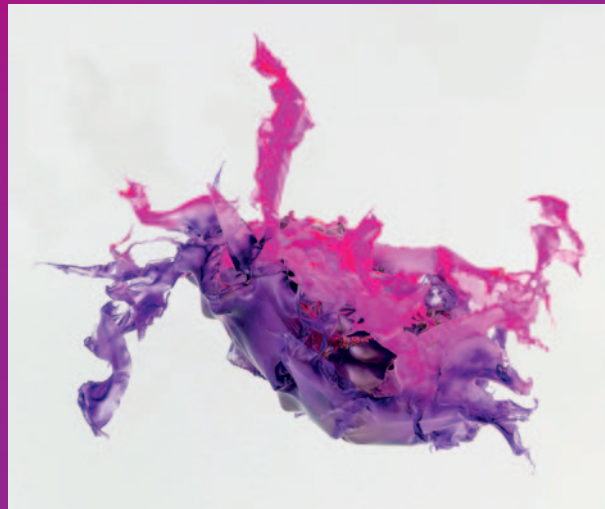
Aljoscha, Teleology of Alien, 2025

17./18. Mai, 11–17 Uhr. Familienhighlight mit spannenden Angeboten für Kinder im Rahmen des Internationalen Museumstags.